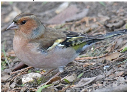
Зяблик Fringilla coelebs Common Chaffinch