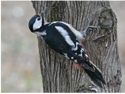
Большой пёстрый дятел Dendrocopos major Great Spotted Woodpecker