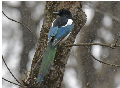
Сорока Pica pica Eurasian Magpie