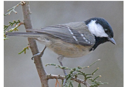
Московка Periparus ater Coal Tit