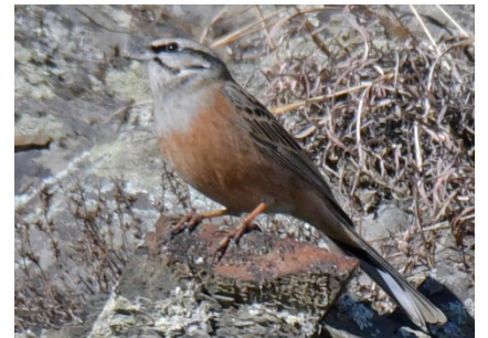
Горная овсянка Emberiza cia Rock Bunting