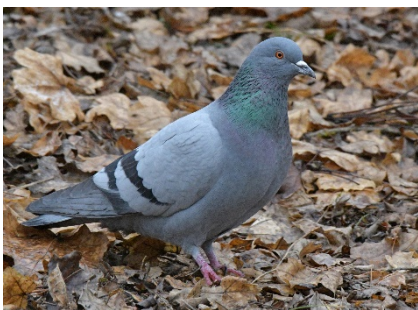
Сизый голубь Columba livia Rock Dove