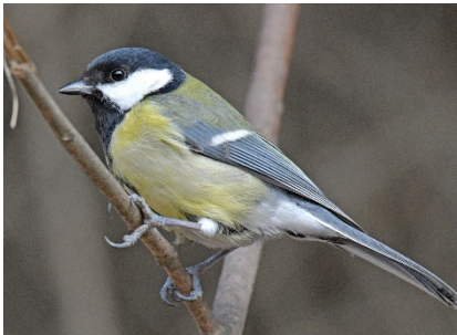
Большая синица Parus major Great Tit