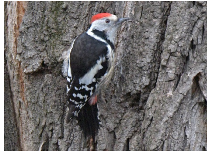
Средний пёстрый дятел Dendrocoptes medius Middle Spotted Woodpecker