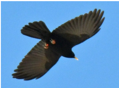
Альпийская галка Pyrrhocorax graculus Alpine Chough