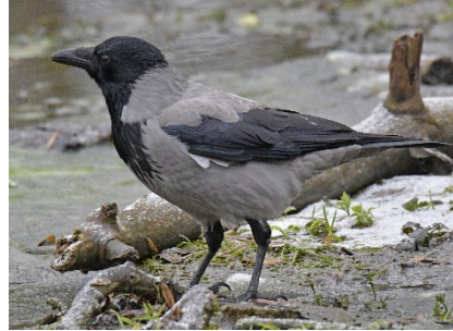
Серая ворона Corvus cornix Hooded Crow