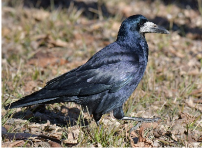
Грач Corvus frugilegus Rook