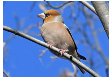
Дубонос Coccothraustes coccothraustes Hawfinch