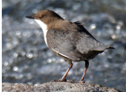
Оляпка Cinclus cinclus White-throated Dipper