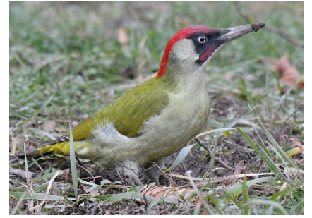
Зелёный дятел Picus viridis European Green Woodpecker