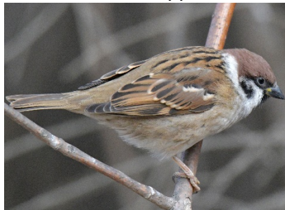
Полевой воробей Passer montanus Eurasian Tree Sparrow