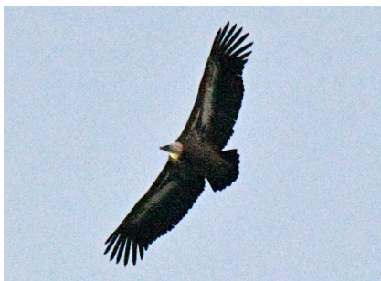
Белоголовый сип Gyps fulvus Griffon Vulture