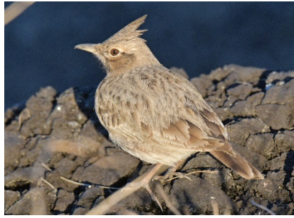
Хохлатый жаворонок Galerida cristata Crested Lark