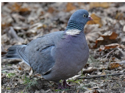
Вяхирь Columba palumbus Common Wood Pigeon