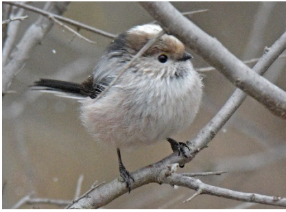
Ополовник Aegithalos caudatus Long-tailed Tit