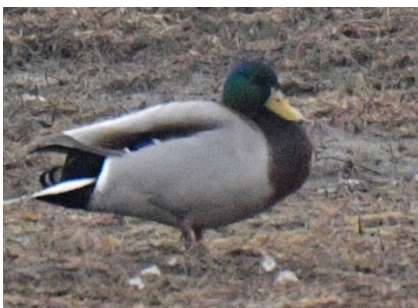
Кряква Anas platyrhynchos Mallard

https://ebird.org/tripreport/326865 . Фотогалерея снятых за эту поездку птиц: