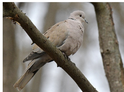
Кольчатая горлица Streptopelia decaocto Eurasian Collared Dove