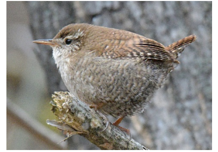
Крапивник Troglodytes troglodytes Eurasian Wren