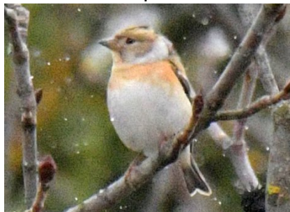
Юрок Fringilla montifringilla Brambling