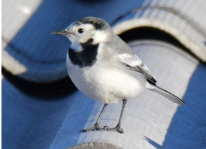
Белая трясогузка Motacilla alba White Wagtail