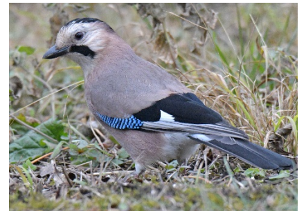
Сойка Garrulus glandarius Eurasian Jay