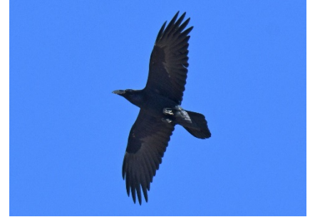
Ворон Corvus corax Northern Raven