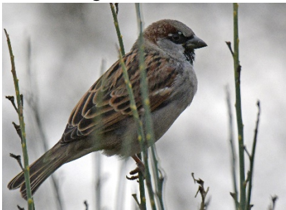
Домовый воробей Passer domesticus House Sparrow