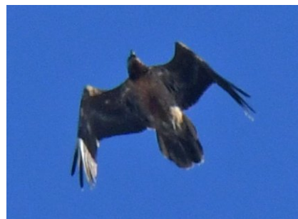
Бородач Gypaetus barbatus Bearded Vulture