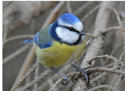
Лазоревка Cyanistes caeruleus Eurasian Blue Tit