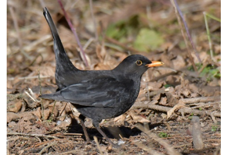
Чёрный дрозд Turdus merula Common Blackbird