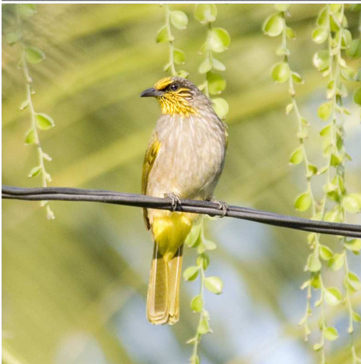
Пестрогрудый бюльбюль - Stripe-throated Bulbul - Pycnonotus finlaysoni

Азиатский пальмовый стриж - Asian Palm Swift - Cypsiurus balasiensis Домовый стриж - House Swift - Apus nipalensis Обыкновенный зимородок - Common Kingfisher - Alcedo atthis Красноклювый зимородок - White-throated Kingfisher - Halcyon smyrnensis Ошейниковый зимородок - Black-capped Kingfisher - Halcyon pileata Синехвостая щурка - Blue-tailed Bee-eater - Merops philippinus Буроголовая щурка - Chestnut-headed Bee-eater - Merops leschenaultia Восточный широкорот - Dollarbird - Eurystomus orientalis Береговушка - Sand Martin - Riparia riparia Деревенская ласточка - Swallow - Hirundo rustica Тихоокеанская ласточка - Pacific Swallow - Hirundo tahitica Рисовый конек - Oriental Pipit - Anthus rufulus Берингийская желтая трясогузка - Chukotka Yellow Wagtail - Motacilla tschutschensis Горная трясогузка - Grey Wagtail - Motacilla cinerea