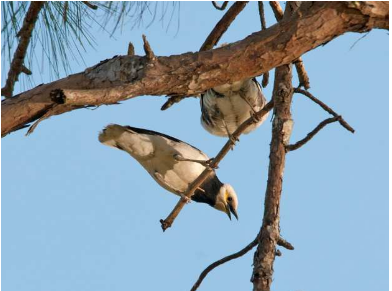
Black-collared starling Sturnus nigricollis Черношейный скворец 7 марта 10 в Далате