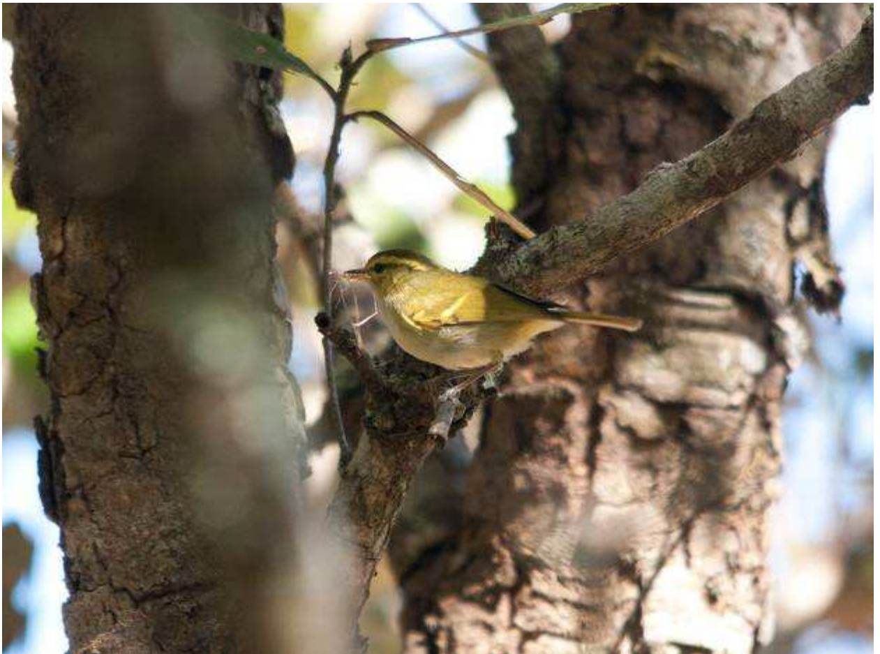
White-tailed Leaf Warbler Phylloscopus davisoni Белохвостая пеночка 6 марта 2 на горе Ланг Биан

Common Tailorbird - Orthotomus sutorius - Славка-портниха 28 февраля 1 в ботаническом саду Хошимина